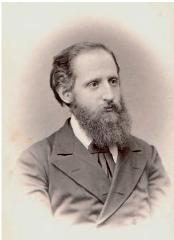
»Es war ein großer, schöner Mann; ein langer Bart umrahmte sein Gesicht, und tief dunkelblaue Augen sprachen aus demselben von Liebe und Güte.« (Bertha Pappenheim, Die Weihernixe). – Josef Breuer in jungen Jahren.

Behandlung zahllose Abende mit seiner Patientin. Sigmund Freud hat daraus Schlussfolgerungen gezogen, die er seiner Verlobten und späteren Ehefrau Martha Bernay, einer engen Freundin Bertha Pappenheims, in einem Brief vom 31. Oktober 1883 anvertraute: »Kannst Du schweigen, Marthchen? Es ist ja nichts Unehrenhaftes, aber etwas ganz Intimes u. das behält man für sich u. seine Geliebte.« Freud stellt in seinem Brief Bertha als Nymphe dar, der die Ärzte reihenweise verfallen. Von einem Kollegen, der sie im Sanatorium betreut, sagt er: »Er ist ganz entzückt von dem Mädchen, ihrem pikanten Aussehen trotz der grauen Haare, ihrem Witz u. ihrer Klugheit. Ich glaube, wenn er nicht als Irrenarzt so genau wüßte, was die Neigung zu schweren hysterischen Erkrankungen für ein Kreuz ist, würde er sich in sie verliebt haben.« Und auch Josef Breuer bleibt vom Klatsch des verliebten Verlobten nicht verschont: »Breuer hat ebenfalls