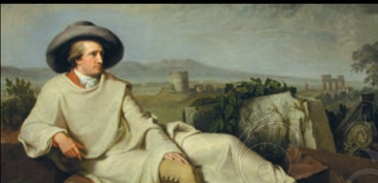
Bildnachweis: Johann Heinrich Wilhelm Tischbein, Goethe in der römischen Campagna, 1787, Städels Museum, Frankfurt am Main, Foto: Städels Museum - Artothek